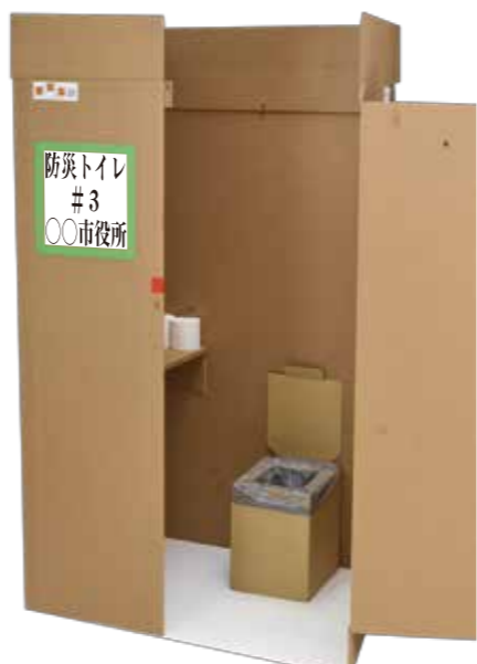
簡易トイレの用途例 トイレの販売はございません。別途お求めください。