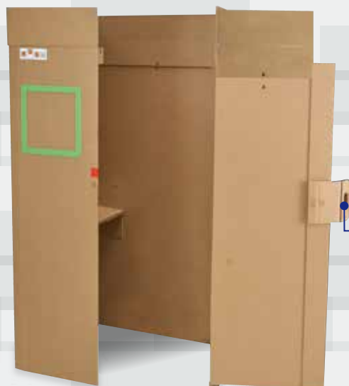
[標準仕様/延長パネル付き]