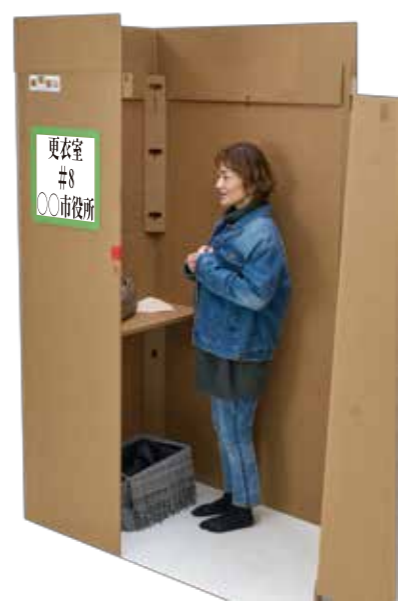
更衣室の用途例 ミラーの取付可能(オプション)